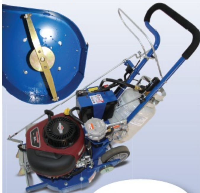
Item # 5E-10520