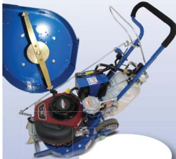
Item # 5E-10520