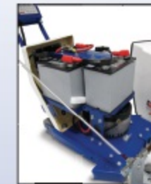
Item # 5E-40 000