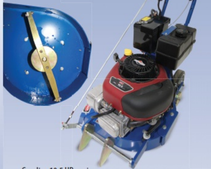
Item # 5E-10510