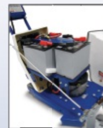
Item # 5E-40 000