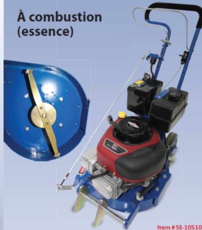
Item # 5E-10510